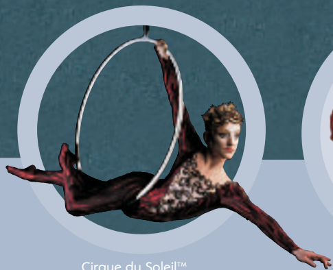
Cirque du Soleil™ Mix van spektakel en poëzie