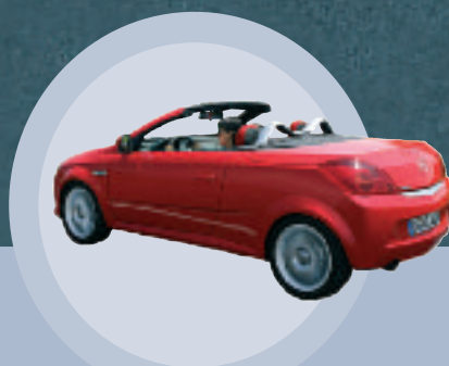
Tigra TwinTop Emotioneel... en rationeel