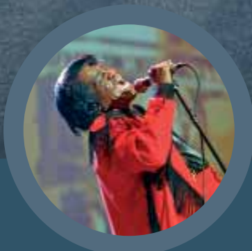
Night of the Proms A never-ending success story