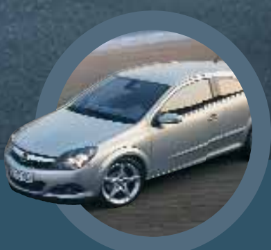
Astra GTC Verlang naar verleiding...