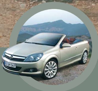
Opel au Salon de l'Auto 2006