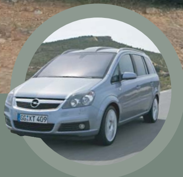
Astuce Fleet Zafira diesel automatique