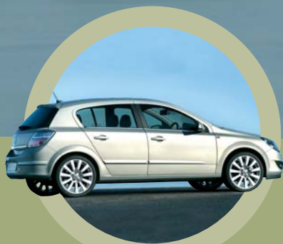
Nouvelle Opel Astra Mise à jour esthétique et technique