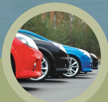
OPC Experience Superlatifs au rendez-vous