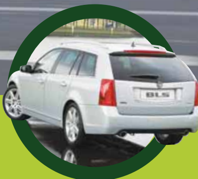
Cadillac Luxe als sleutelwoord