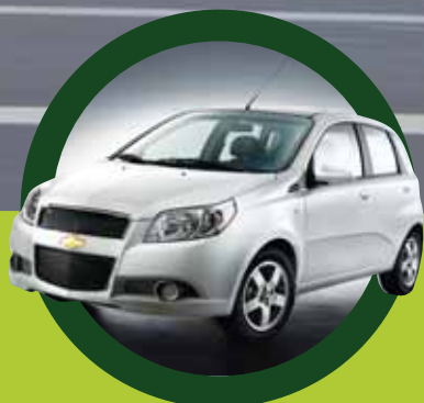
De nieuwe Chevrolet Aveo