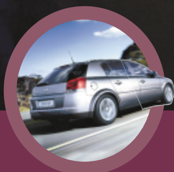
Opel Signum, bevlogen klasse