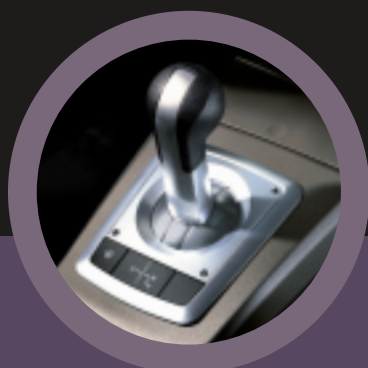
De nieuwe Astra de dynamiek van een winnaar