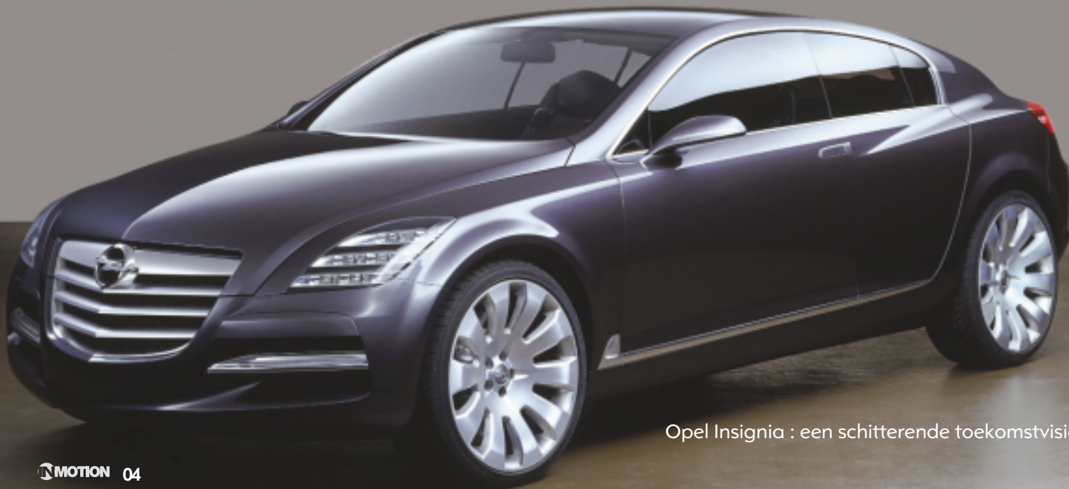
Opel Insignia : een schitterende toekomstvisie!

Voor ons heeft creativiteit pas zin als we er uw eisen mee kunnen overtreffen.