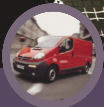
Opel Vivaro design en functionaliteit verenigd